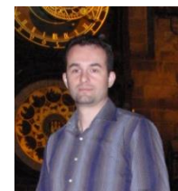
Επ. Καθηγητής Κωνσταντίνος Τσίχλας