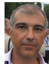
Αν. Καθηγητής Νικόλαος Βασιλειάδης