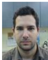
Επ. Καθηγητής Γρηγόριος Τσουμάκας